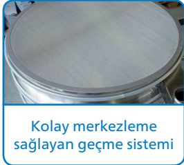
Kolay merkezleme sağlayan geçme sistemi