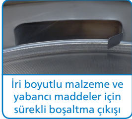
İri boyutlu malzeme ve yabancı maddeler için sürekli boşaltma çıkışı