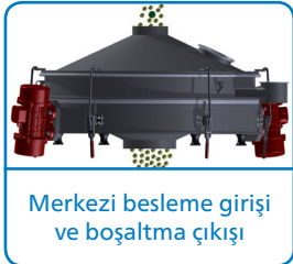
Merkezi besleme girişi ve boşaltma çıkışı