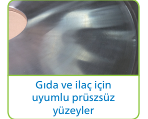
Gıda ve ilaç için uyumlu prüşsüz yüzeyler