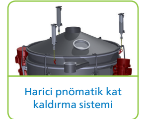
Harici pnömomatik kat kaldırma sistemi