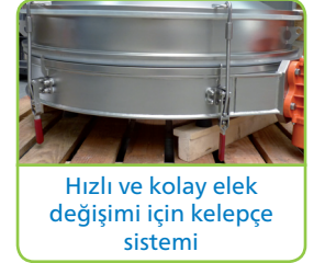
Hızlı ve kolay elek değişimi için kelepçe sistemi