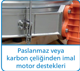
Paslanmaz veya karbon çeliğinden imal motor destekleri