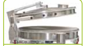
Pnömatik açılır kapak