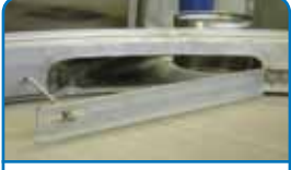
Yön değiştirici ile kolay ince ayar