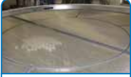
Otomatik merkezlenen elek yüzeyleri