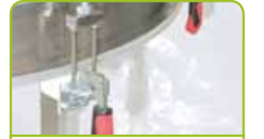
Kolay elek yüzeyi değişimi için hızlı kelepçe sistemi