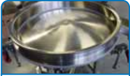
Paslanmaz çelikten bağlantı parçaları 1.4301